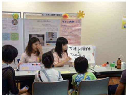
(燃料電池を作っている風景) (会場に来ていた子どもたちと学生ボランティア)