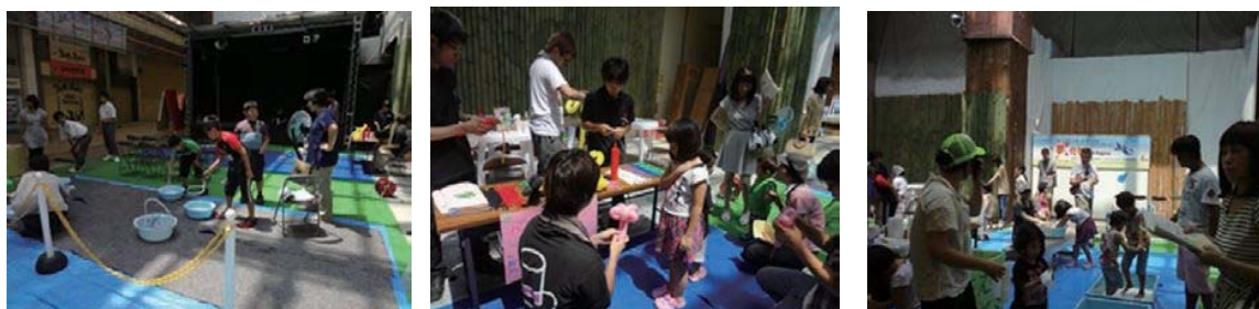
(ジャンヌガーデンの様子)

ジャンヌガーデンに野外活動型のおもしろ科学実験、香川大学サークル、メルシー(笑)クラブによるバルーンアートのステージを行うことにより、多くの人をトキワ街に呼び込むことができました。おもしろ科学実験では、子どもたちが裸足で入って感触を楽しむダイラタンシーや大きなシャボン玉を作って遊べ、野外活動ということもあり、とても楽しんでもらえました。本事業は、香川大学教育学部・教育学研究科の学生だけではなく、医学部、工学部、農学部学生および企業とのコラボレーションを実施していますが、今年は、さらに、サークルや地域の中学校も一緒に活動することができ、さらに幅が広がりました。また、会場も3会場になり、その分準備が大変でしたが、うまく活動できたと思います。